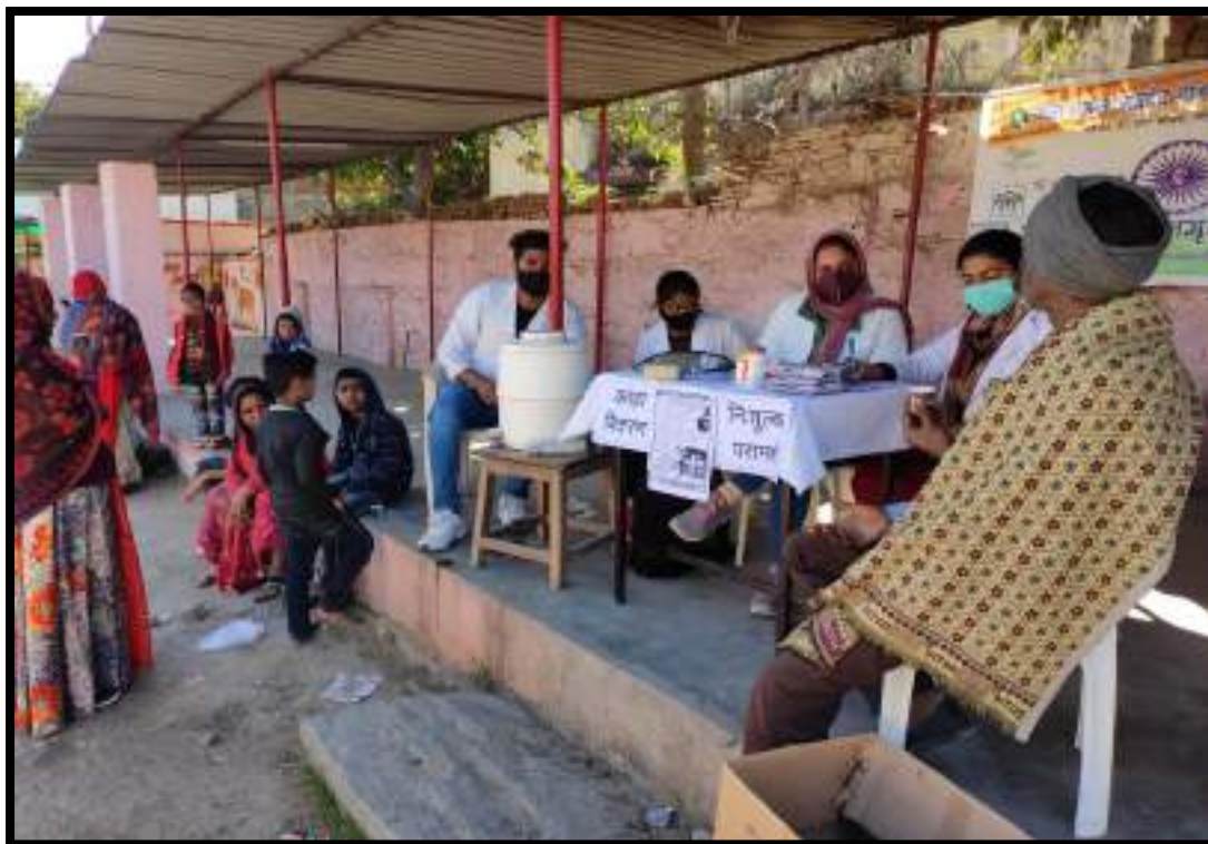
On 29 January, Occasion of World Leprosy Day Seminar was organized by Kayachikitsa Department In our college.